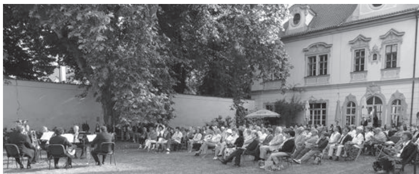
Koncert u maltéžských rytířů se v červnu pravidelně odehrává na zahradě

Základem repertoáru je varhanní hudba zpestřená dalšími instrumentál-