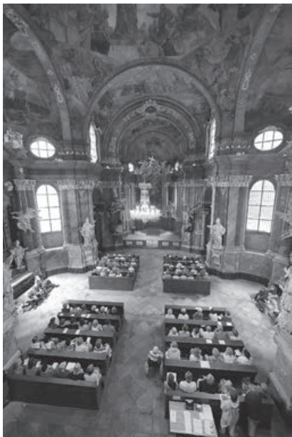
Koncerty v krásném prostředí kostela sv. Kateřiny v Praze 2.

V minulém čísle Psalteria (3/2016) se představily tři dlouholeté projekty Společnosti pro duchovní hudbu. Jiří Kub uvedl své dojmy z prvních dvou koncertů v rámci festivalu Dny soudobé hudby 1 . Připomeňme neúnavné úsilí o začlenění