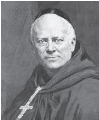
Obr. 2: Dom Guéranger, (1805-1875) 1. opat v Solesmes

teorie a z byzantského zpěvu. Do chorálu se dostávaly i arabské vlivy přes mozarabský chorál (tj. v překladu "pod Araby" vzniklý) poněvadž vznikl po dobytí Španělska Araby tj. po roce 711.