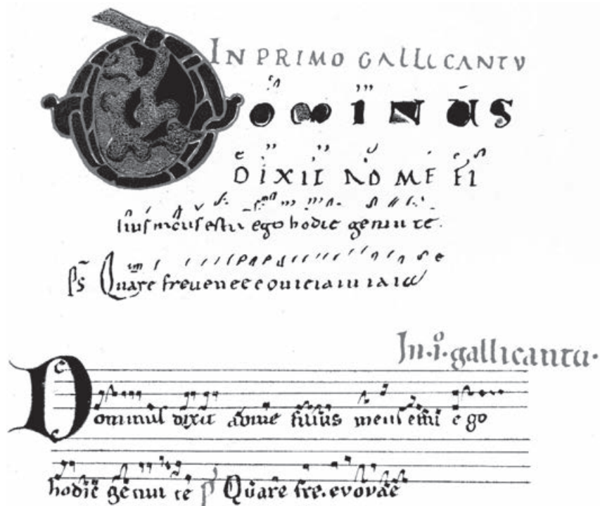
Obr. 1: Ukázka neumové adiaستمatické notace z kodexu z X. století (nahore) a ze XIII stol. (dole).

Gregoriánský chorál je jednohlasý zpěv, který vznikl pro liturgii latinského ritu. Kořeny gregoriánského chorálu sahají k židovským synagógním zpěvům . Z nich bere základní princip niterné vazby zpěvů na text a ze zvyklostí židovské liturgie. Vychází též ze zpěvu žalmů. Další ovlivnění pochází z hudební tradice orientu a oblasti Středozemního moře, z řecké hudební