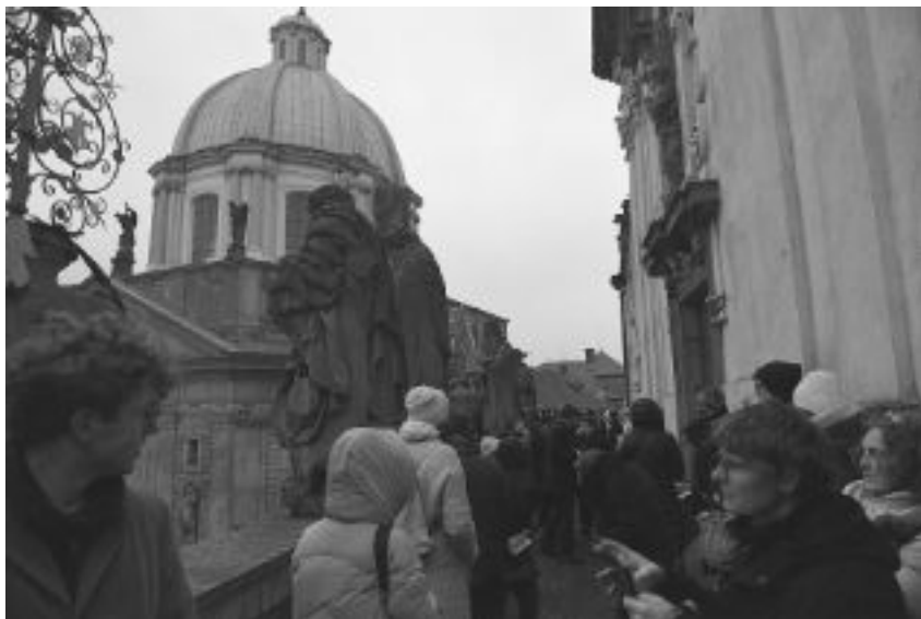
Rorátní mše Na Střeše se letos odehrála Na balkóně Nejsv. Salvátora

Přátelé Karla Schwarzenberga s tím, že by rádi, aby u rakve vystavené v kostele Panny Marie pod řetězem zazněly roráty jako se zpívají u Salvátora. Karel Schwarzenberg měl ke zpěvu rorátů v adventu silný a osobní vztah. Narodil se 10. 12. 1937 a právě roráty ho provázely při příchodu na tento svět. Ten den totiž jeho maminka z ranní rorátní mše v Emuzích jela přímo do porodnice.