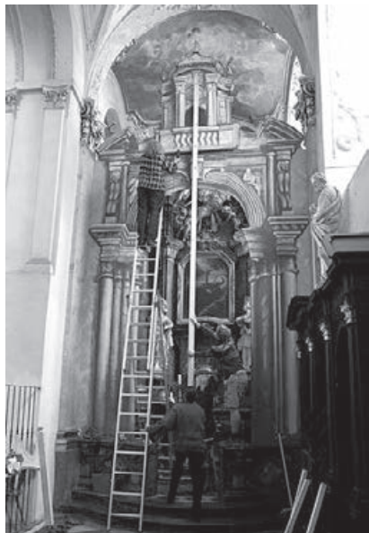
Obr. 4 – První stavba 2010 byla ve výšce 6 metrů velmi odvážná, dnes se používá mobilní lešení.

Partitura je dnes uložena v drážďanské Zemské knihovně a je nato-