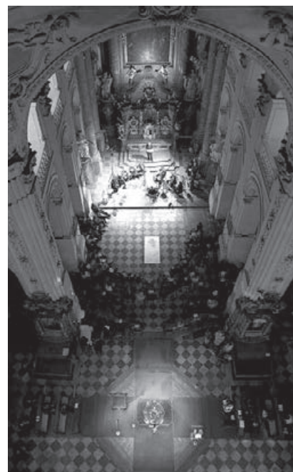
Obr. 5 – Provedení Zelenkova oratoria I Penitenti na Velký pátek 2010.

bylo oratorium provedeno 20. dubna na Velký pátek 1753 ve dvanáct hodin v poledne v pražském karmelitánském kostele sv. Havla, tedy v těsném sousedství operního divadla v Kotcích. Jeho téma, Pilátova věta „ Ejhle člověk “ se často vyskytuje v barokním výtvarném umění a není vyloučené, že Pilát, Ježíš, Hříšník a Kajcínk stává proslulý Pilátův výrok do různých souvislostí, tak jak to umožňuje vrcholná barokní rétorika. Velmi neobvyklá je instrumentace, která kromě smyčců, hobo-