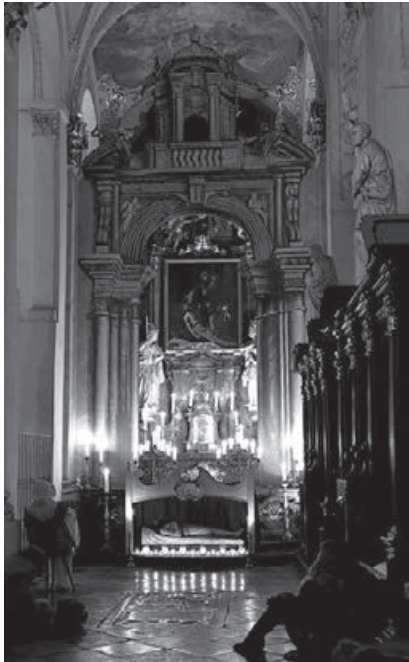
Obr. 1 – Boží hrob u Nejsv. Salvátora instalovaný od roku 2010 v boční lodi

Vyvrcholení kalendářního i liturgického roku pro nás dnes představuje vánoční doba. Z pohledu dnešního člověka je to logické – advent je obdobím čekání a napětí (lépe řečeno obdo-